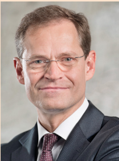
Michael Müller, Regierender Bürgermeister von Berlin:

„Die Gründerinnen- und Unternehmerinnenzentren liegen alle mitten in der Stadt – im Gegensatz zu den klassischen Technologie- und Gründerzentren. Die Zentren für Frauen orientieren sich damit am Mobilitätsverhalten von Frauen, die mehr kurze Wege pro Tag zurücklegen, z. B. zum Einkaufen oder um ihre Kinder von A nach B zu bringen. Auch bieten mehr Frauen als Männer Dienstleistungen an, und auch die Kundinnen und Kunden finden sich eher in der Innenstadt als an der Peripherie.“